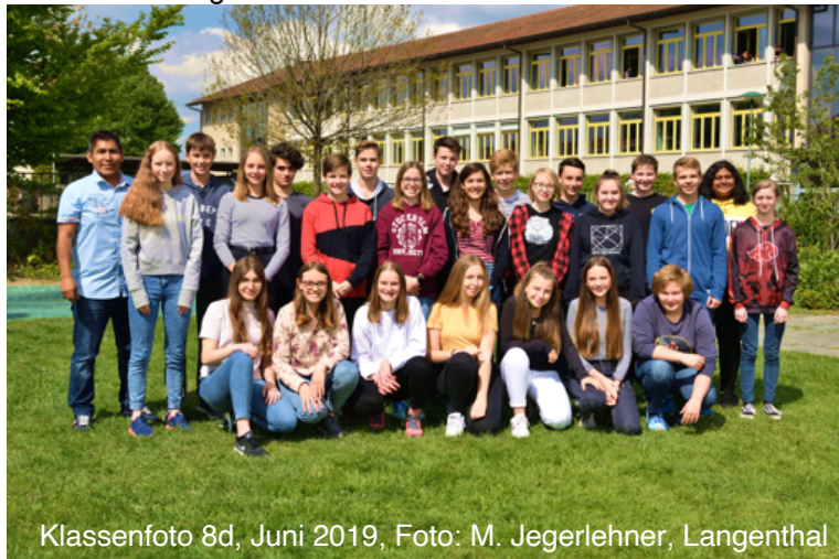
Klassenfoto 8d, Juni 2019

Inkwil Herzogenbuchsee Herzogenbuchsee Niederönz Herzogenbuchsee Inkwil Herzogenbuchsee Inkwil Herzogenbuchsee Wanzwil Herzogenbuchsee Röthenbach