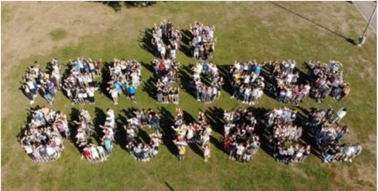
Start in das Schuljahr 18/19 20. August 2018