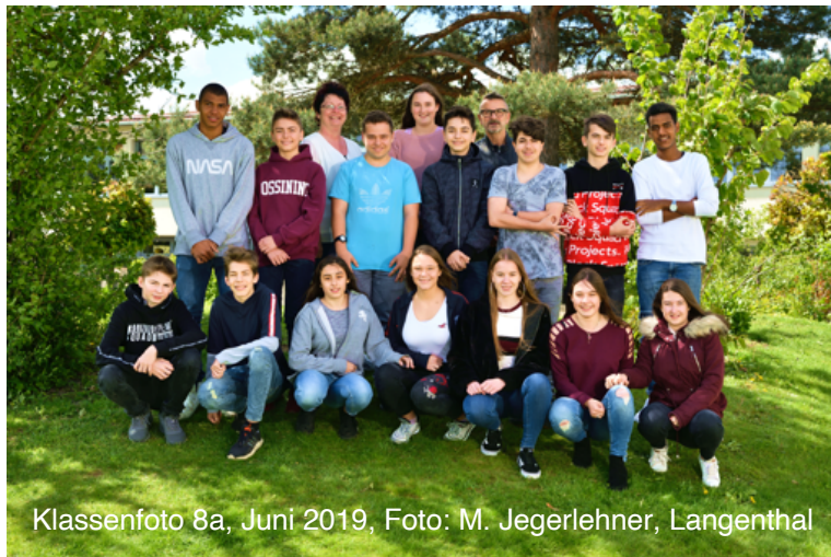
Klassenfoto 8a, Juni 2019, Foto: M. Jegerlehner, Langenthal