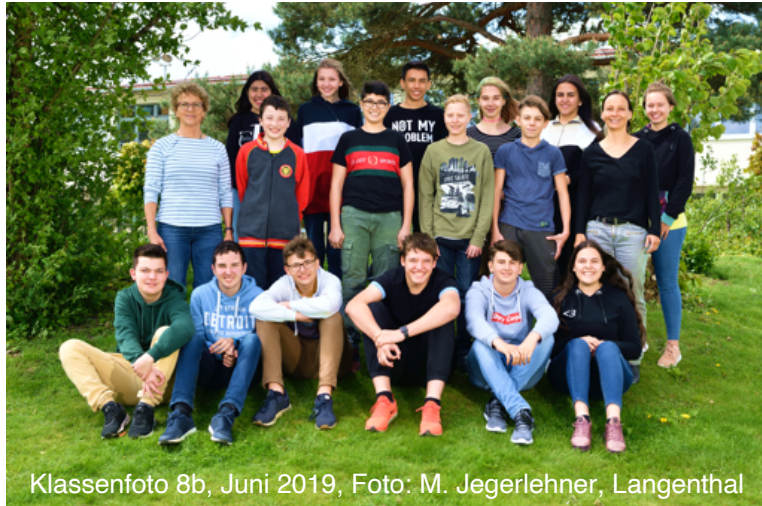
Klassenfoto 8b, Juni 2019, Foto: M. Jegerlehner, Langenthal