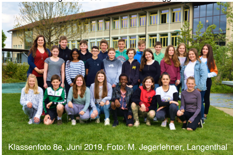
Klassenfoto 8e, Juni 2019, Foto: M. Jegerlehner, Langenthal

Herzogenbuchsee Niederönz Oberönz Herzogenbuchsee Herzogenbuchsee Herzogenbuchsee Herzogenbuchsee Herzogenbuchsee Herzogenbuchsee Herzogenbuchsee Herzogenbuchsee Herzogenbuchsee Niederönz