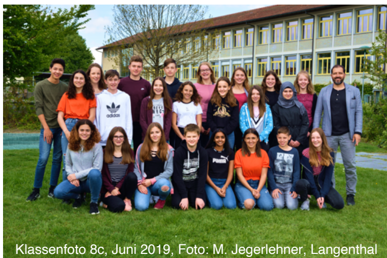
Klassenfoto 8c, Juni 2019